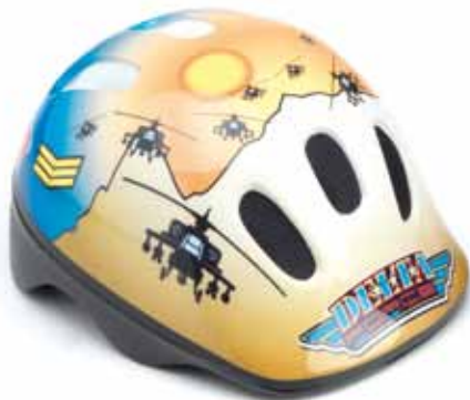
casco delta force